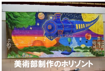
美術部制作のホリゾン