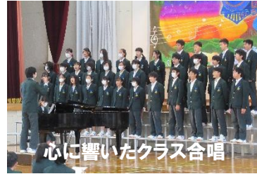
心に響いたクラス合唱