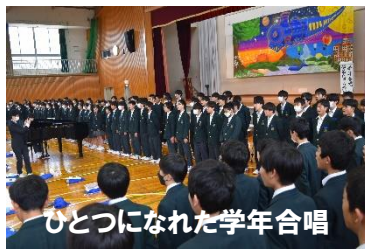
ひとつになれた学年合唱

12月15日（金）合唱コンクールが行われました。保護者の皆さまにも多数ご来場いただき、誠にありがとうございました。