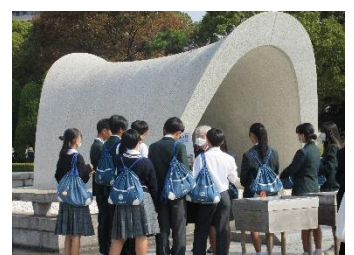
原爆死没者慰霊碑