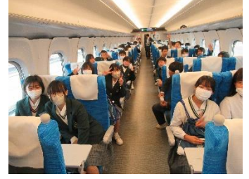
疲れたけどまだまだ元気