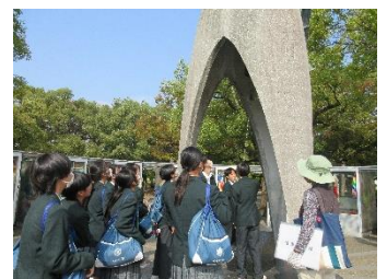
ガイドさんの案内で碑めぐり