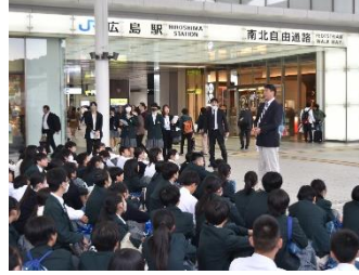
広島駅 ekie で買い物をして集合