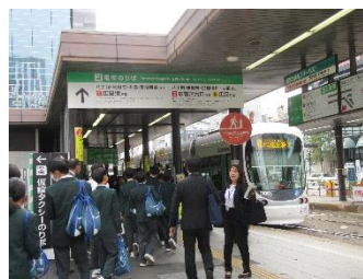
路面電車で原爆ドームへ

広島駅に到着後、路面電車に乗って原爆ドームへ向かい、平和記念資料館で戦争の悲惨さや平和の尊さを学びました。原爆の子の像や原爆死没者慰霊碑など、平和記念公園のさまざまなモニュメントを見て回り、ガイドさんから詳しい説明を聞きました。生徒たちは、自分の目で見て、耳で聞いて、多くの事を肌で感じ取ってきたと思います。