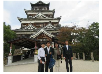
班別自主活動（広島城）