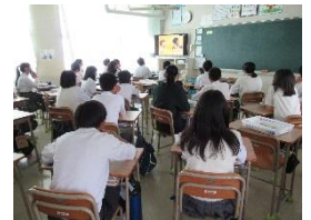
参照「朝日新聞・ザ解説」「はだしのゲン」に涙